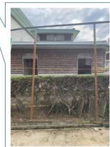
旧 H 3.2m × W 2.15