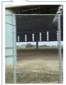
新 H 3.2m × W 2.0