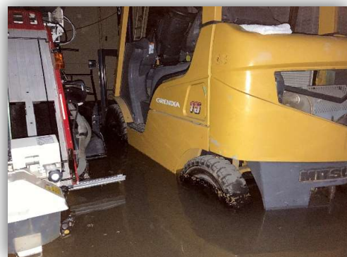
フォークリフト浸水 50cm