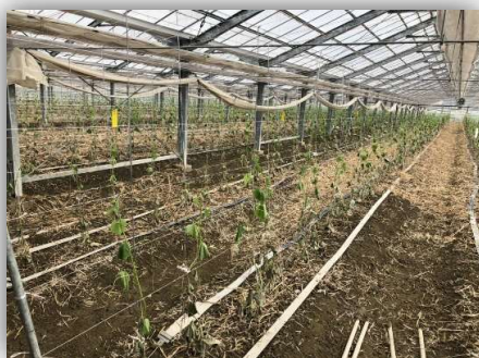
被害状況(きゅうり)