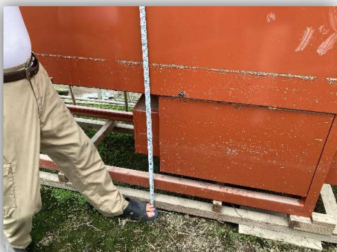
園芸ハウス(加温機)浸水 83cm