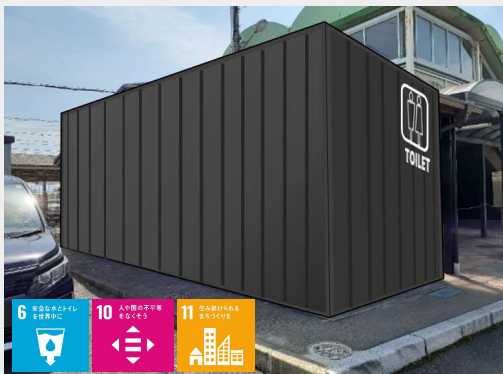
新たに導入予定の設備