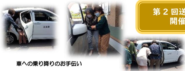
車への乗り降りのお手伝い