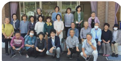
22名の方が参加されました！