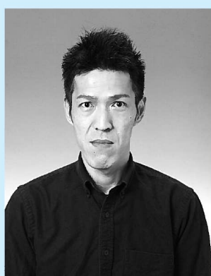
フォトスタジオ写楽：渡邊様に撮影いただきます。

なるべくたくさんの写真を町誌として語り継いでいけるよう努力してまいりますので、ご協力をよろしくお願いいたします。