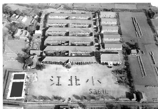
S36.11 江北小学校航空写真

【問い合わせ先】 江北町教育委員会 ども教育課 総務企画係 電話 0952-86-5623