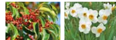
町の木：モチノキ 町の花：スイセン